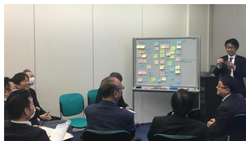
今後10年の社会の変化・技術の変化を考察するワークは全員参加。印刷業界では定番のものから、斬新な将来予測まで、ざっくばらんに意見を出し合いました。

アイ・シー・ラボの印刷業界向けセミナー・勉強会に関するお問い合わせはこちらまでご連絡ください。 pcc@ic-lab.net